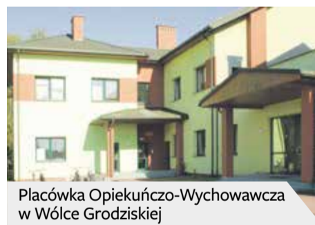
Placówka Opiekuńczo-Wychowawcza w Wólce Grodzkiej

Także i osoby pełnoletnie opuszczające pieczę zastępczą mają zapewnione wsparcie. Wychowankowie