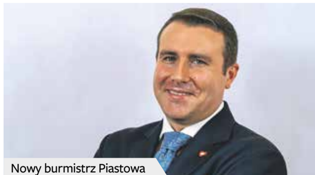
Nowy burmistrz Piastowa